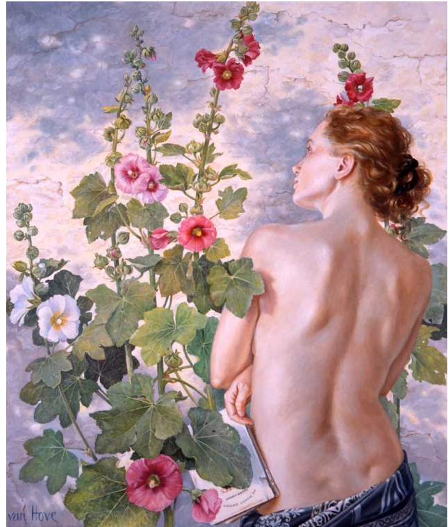
Les Roses trémières, 2012, oil on canvas, 73 x 60 cm