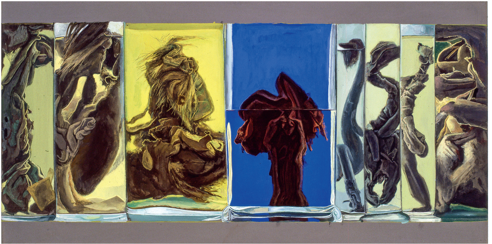
À gauche, en haut Grand Tableau long n°6, 2012-2013, h/t, 120 x 800 cm, détail TOUTES LES ŒUVRES : COURTESY DE L'ARTISTE.