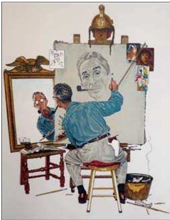
NORMAN ROCKWELL, TRIPLE SELF-POURTRAIT, 1960, 78 X 61 CM.

Norman Rockwell (1894-1978) illustre son premier livre, Tell me Why , à l'âge de 16 ans et propose six ans plus tard sa première couverture pour The Saturday Evening Post , magazine où il fera la quasi-totalité de sa carrière. Cette collaboration représente une somme de dessins préparatoires, croquis,