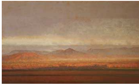
TERUHISA YAMANOBE, GRAND PAYSAGE, 2013, HUILE SUR TOILE, 162 X 97 CM. COURTESY GALERIE RAUCHFELD