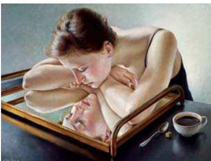
FRANCINE VAN HOVE, EAU/MIROIR, 2013, HUILE SUR TOILE, 50 X 65 CM. © FRANCINE VAN HOVE

esquisses... pour un total de 420 couvertures. Malheureusement, la totalité de son œuvre ne parviendra pas jusqu'à nous, certaines toiles étant perdues ou détruites dans l'incendie de son atelier en 1943. La galerie propose des lithographies inédites issues de la collection privée de l'éditeur de l'artiste new-yorkais, numérotées et signées, fournies avec leur certificat d'origine... Du 9 mars au 6 avril , vernissage le 8 mars, galerie Anagama, 5, rue du Bailliage, 78000 Versailles, tél. : 01 39 53 68 64, www.anagama.fr